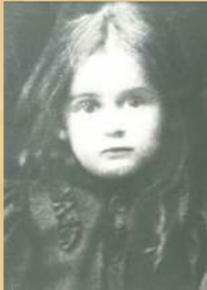
L'esperienza indiretta del suicidio durante la prima infanzia