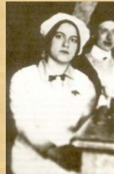
L'esperienza diretta della morte: il servizio presso un ospedale da campo durante la prima guerra mondiale