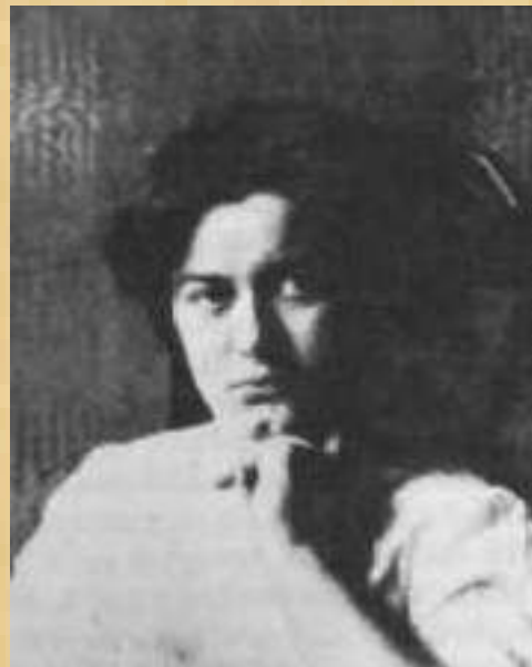
L'adolescenza e la nascita della domanda sulla morte