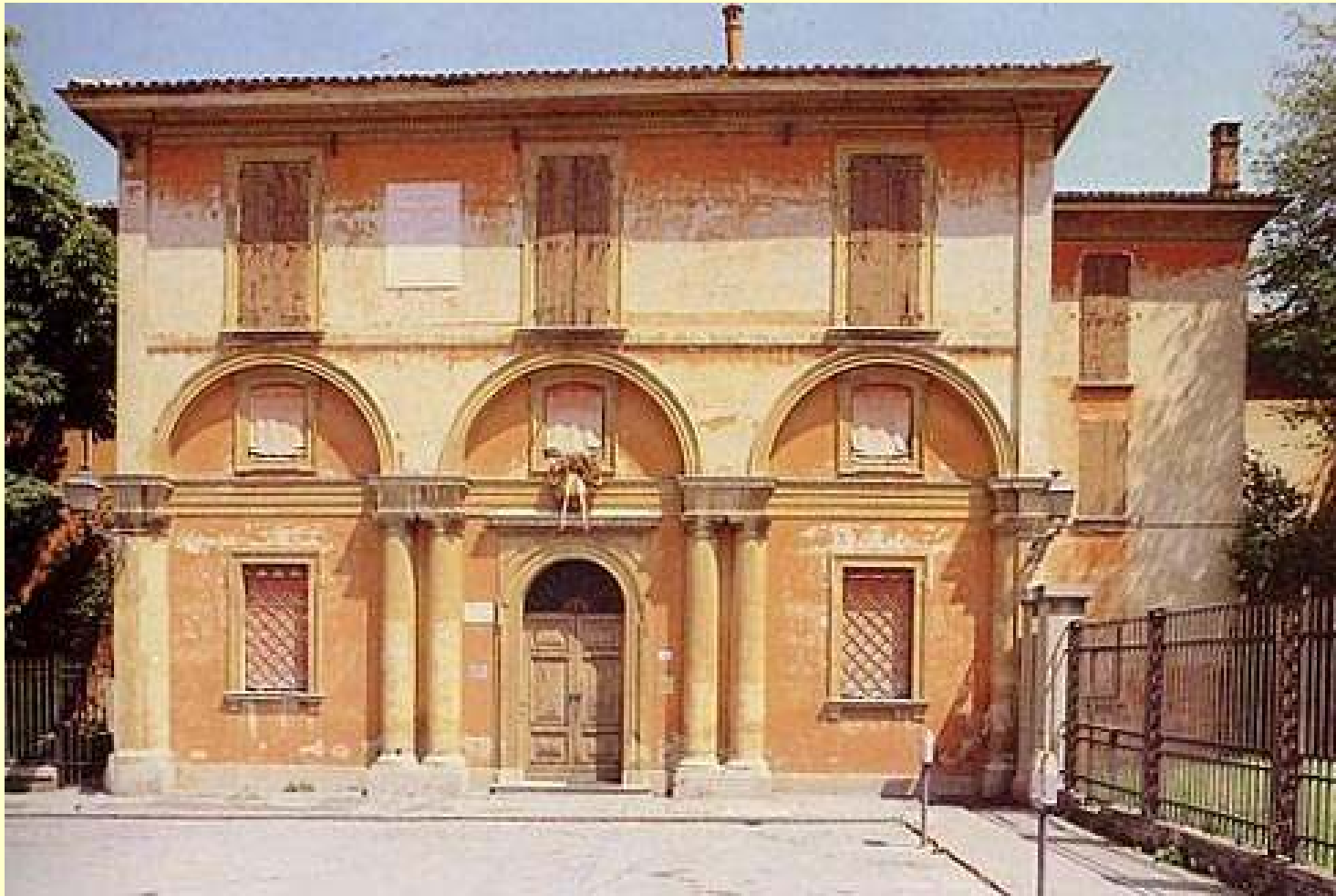
La sua casa di Bologna