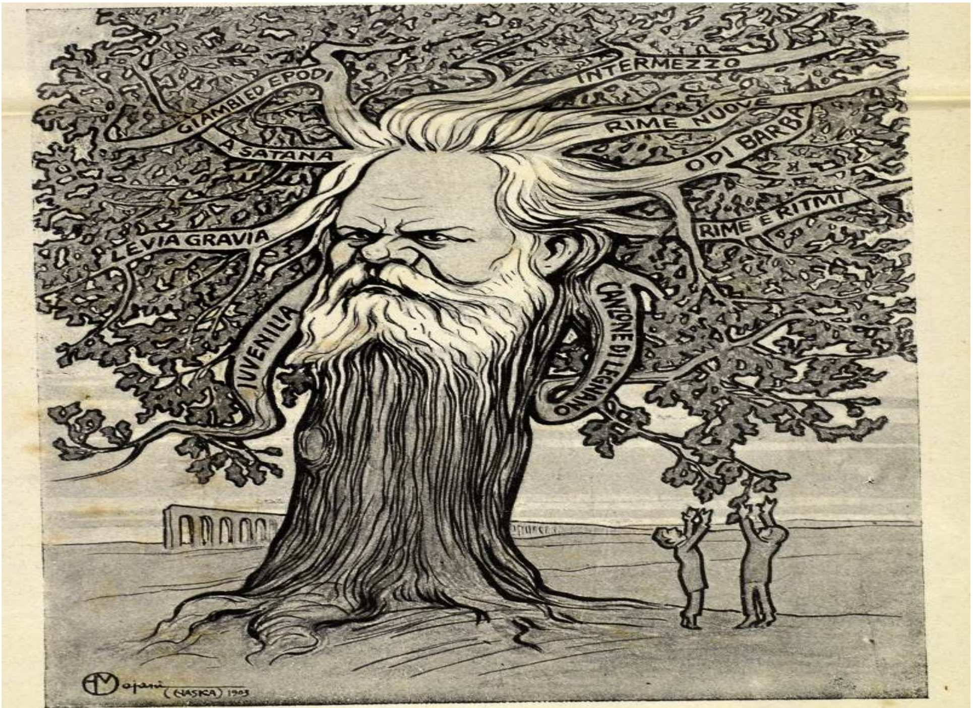
Come quercia druidica sta il tuo fatal lavoro.